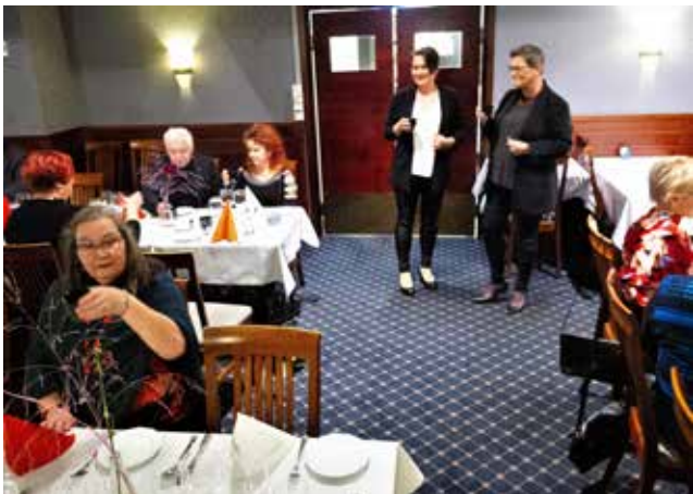
Yhteisen juhlan kunniaksi nostettiin glögimaljat.