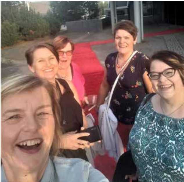
Iloiset terveiset Uudeltamaalta.