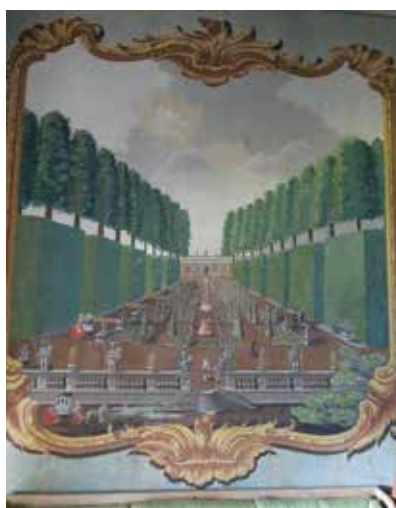
Taidetta Louhisaaren kartanossa.