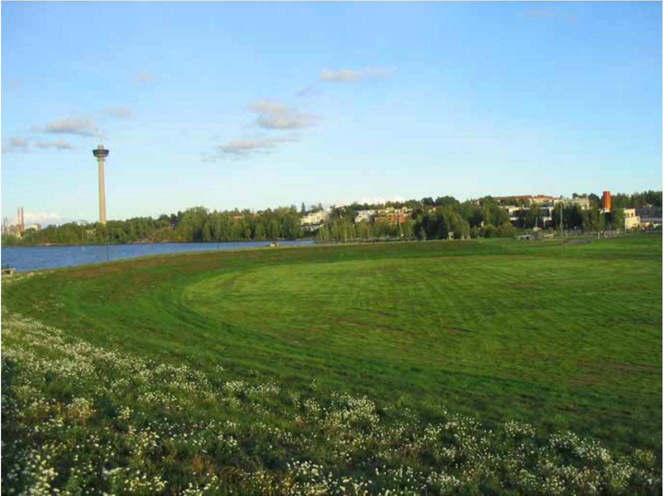
Katsomo- ja kenttäalue