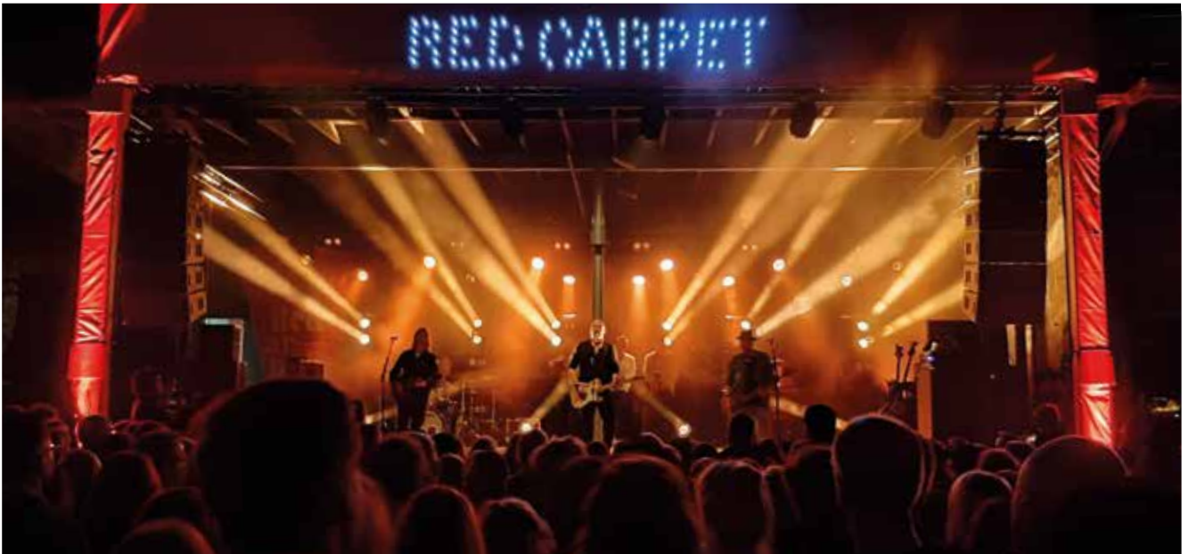
Kari Tapio illan päätösfiiliksissä.